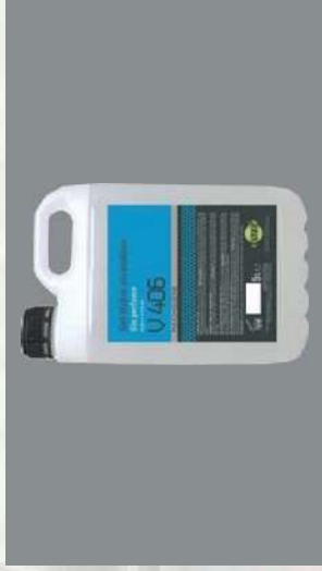
0116850 BOTE 5 L GEL HIDROALCO-HOLICO