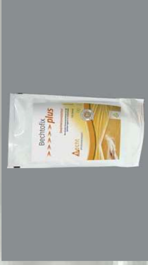
0116347 BOLSA 100 TOALLAS HIGIE- NIZACIÓN MANOS/SUPERFICIES