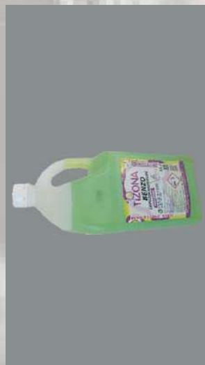
0116747 BOTE 5 L LIMPIADOR HI- GIENIZANTE BENZO