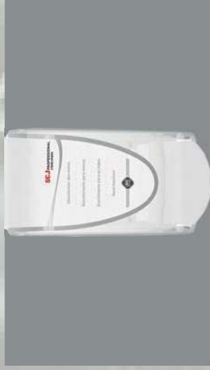
0803349 DOSIFICADOR 1 L INSTANT FOAM