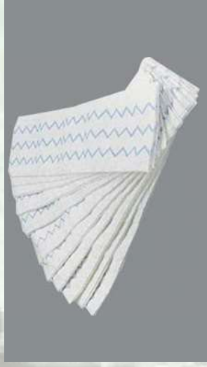
0508364 PAQUETE 150 CUBREMO- PAS DESECHABLES 48 X 14 CM.