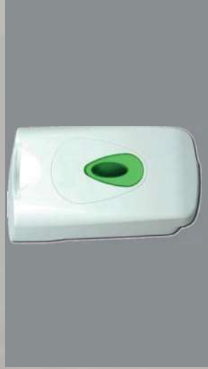
0803201 DISPENSADOR TOALLAS HIGIENIZACIÓN