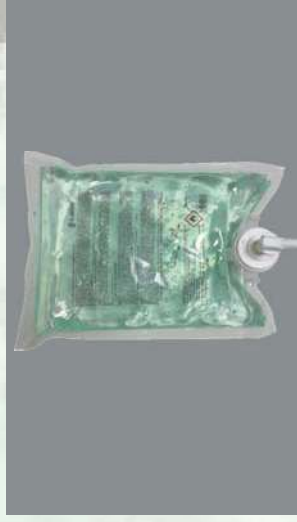
0805677 CARGA 750 ML GEL HI-DROALCOHOL ANIBAL