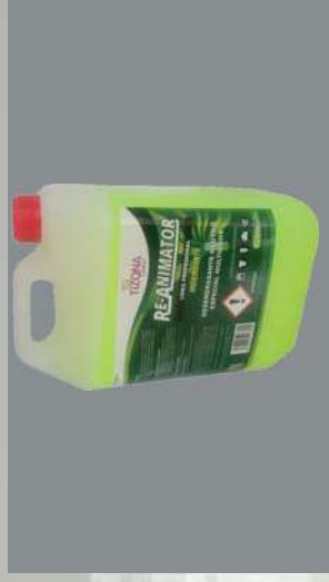
0103217 BOTE 5 L DESENGRASANTE UNIVERSAL RE-ANIMATOR