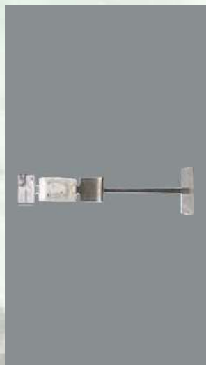
0803335 STAND PARA DOSIFICA- DOR