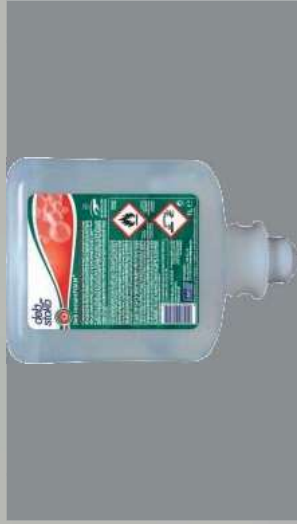
0109345 CARGA 1 L INSTANT FOAM