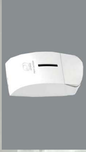
0805676 DOSIFICADOR 750 ML GEL HI-DROALCOHOLICO ANIBAL