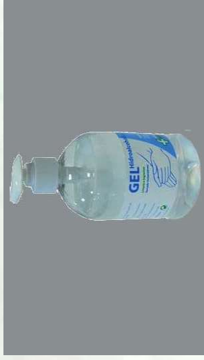
0109401 BOTE 500 ML GEL HI-DROALCOHOLICO