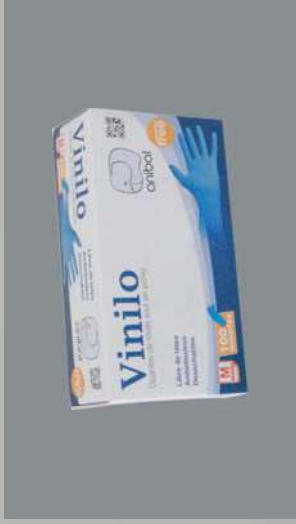
0303219/ 0303220/ 0303221 PAQUETE 100 GUANTES VNILO AZUL