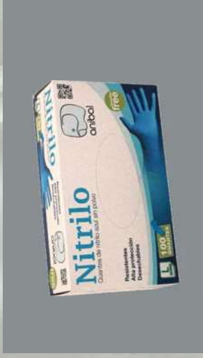
0303231/ 0303230/ 0303232 PAQUETE 100 GUANTES NITRILLO AZUL