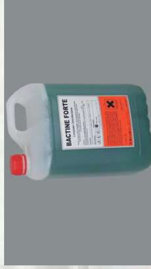
0116708 BOTE 5 L LIMPIADOR BAC- TERICIDA BACTINE FORTE