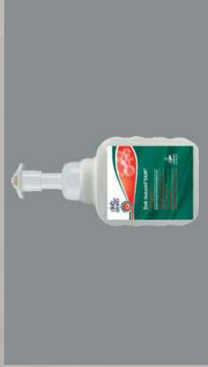
0109309 BOTE 400 ML INSTANT FOAM