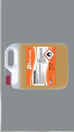
0116745 BOTE 5 L ALCOHOL HIGIE-NIZANTE HIGIEGEL