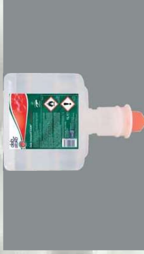
0109308 CARGA 1 L INSTANT FOAM AUTOMÁTICO