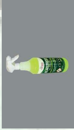
0103216 BOTE 1 L DESENGRASANTE UNIVERSAL RE-ANIMATOR