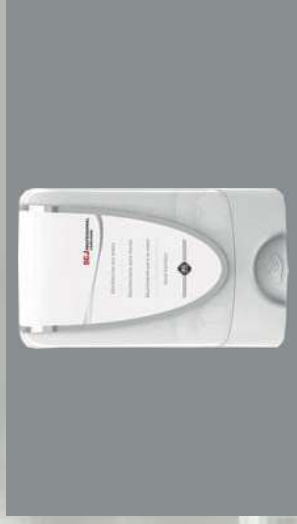
0803346 DOSIFICADOR 1 L INSTANT FOAM AUTOMÁTICO