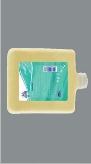
0109239 CARGA 2 L AGROBAC LO- TION WASH