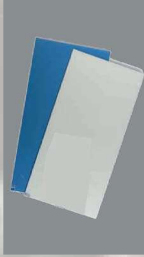
0603510 ALFOMBRA DESECHABLE 60X115 CM