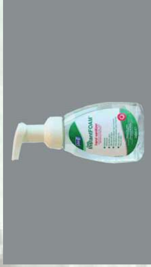
0109306 BOTE 250 ML INSTANT FOAM