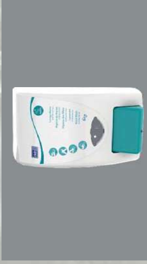
0803297 DOSIFICADOR 2 L CLEANSE ANTIBAC