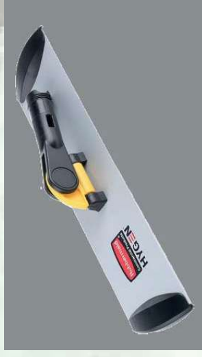
0507282 SOPORTE ALUMINIO PARA MOPAS 40 CM