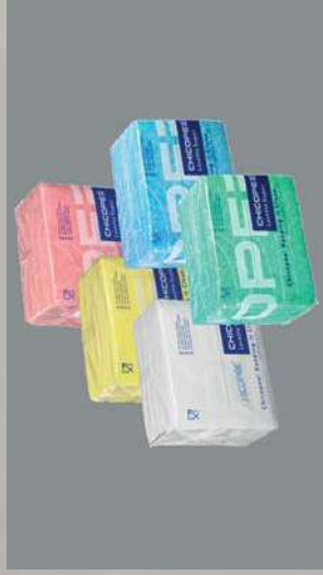
0301079/ 0301089/ 0301134/ 0301084/ 0301102 PAQ. 25 BAYETA LAVETTE