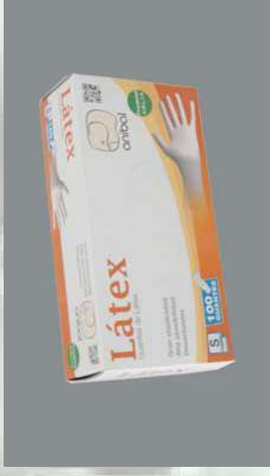
0303242/ 0303241/ 0303240 PAQUETE 100 GUANTES LATEX