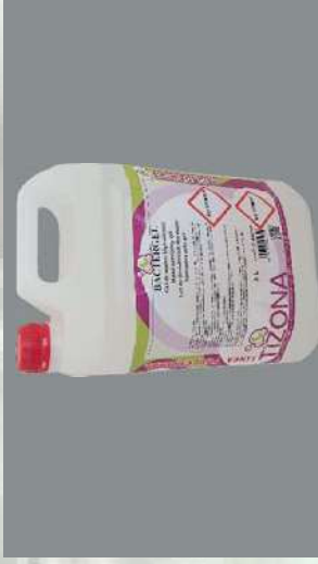
0116229 BOTE 5 L GEL MANOS BAC- TERGEL