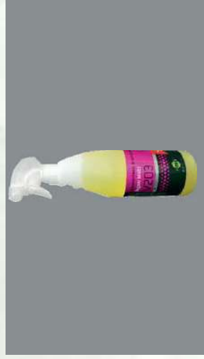
0103230 BOTE 750 ML DESINFEC- TANTE DESENGRASANTE